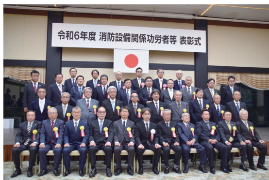
消防設備保守関係功労者表彰受賞者