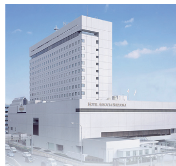
ホテルアソシア静岡