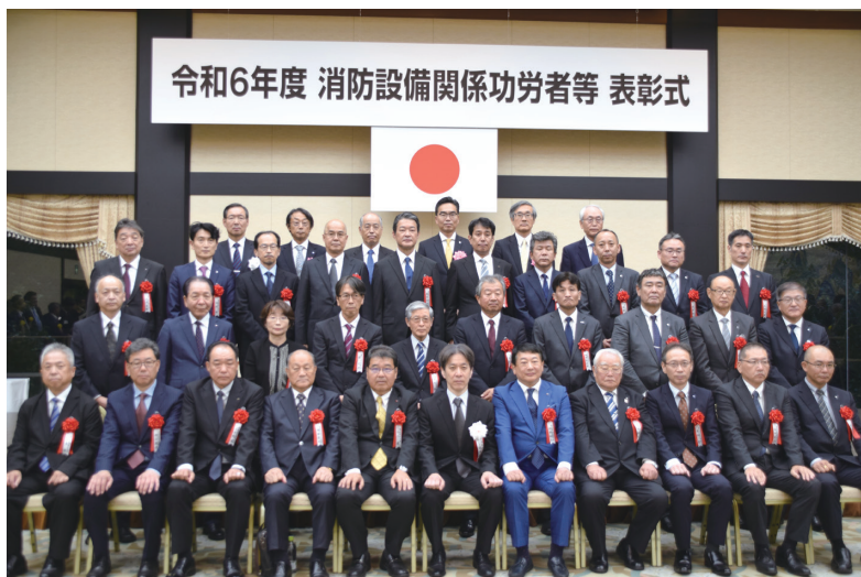
消防機器開発普及功労者表彰受賞者