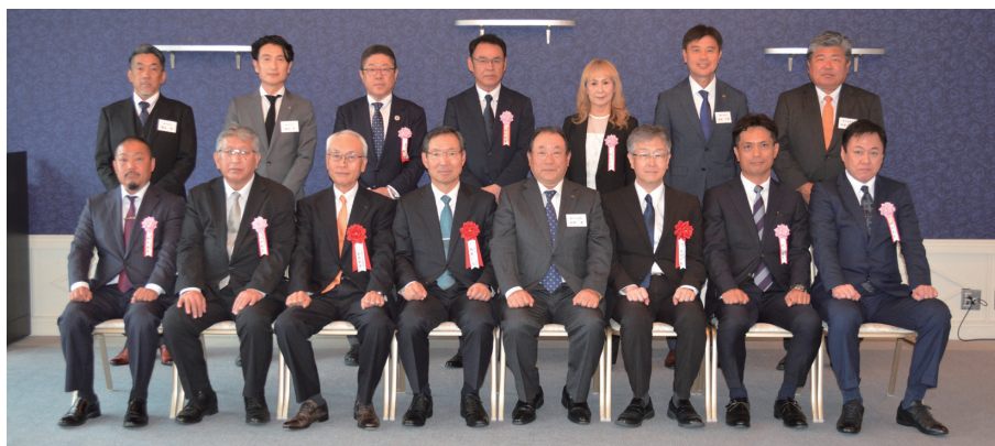
功労者表彰受賞者