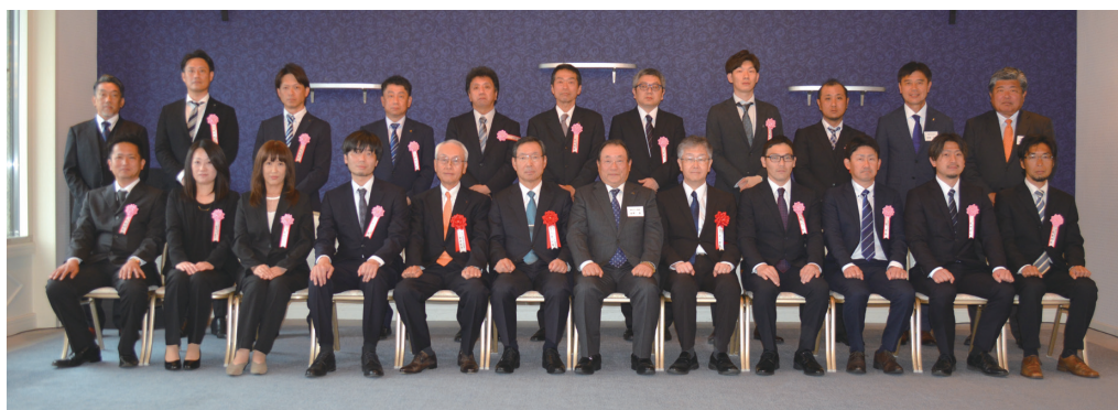
優良従業員表彰受賞者